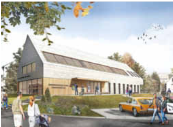
Bürgerbegegnungszentrum mit Arztpraxis