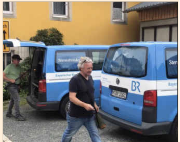
Für die Dreharbeiten ist das Team des Bayerischen Fernsehens mit zwei Bussen angereist.