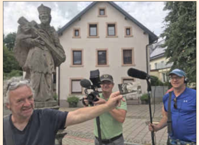
Der Regisseur hält eine alte Ansichtskarte von Marktlegast in die Kamera. Sie dient als Erzählstoff über die alte Zeit.