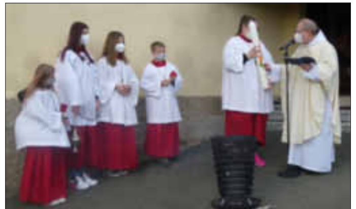
Eröffnet wurde die Osternachtfeier mit dem Anzünden der Osterkerze am gesegneten Osterfeuer vor der Kirche.