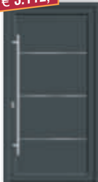
Aluminium-Haustür "7730-94", RAL, Lisenen auf der Außenseite