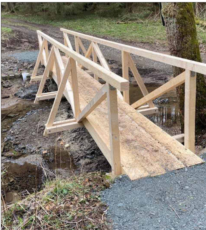
...mach neu! Die Brücke am Mühlenweg wurde erneuert.