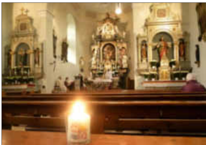
Im vorderen Teil wären noch genügend Sitzplätze frei gewesen, um an diesem wahrscheinlich einmaligen Ereignis teilzunehmen. Für alle die teilnahmen, war es sicher eine wunderbare und ansprechende Osternachtfeier.