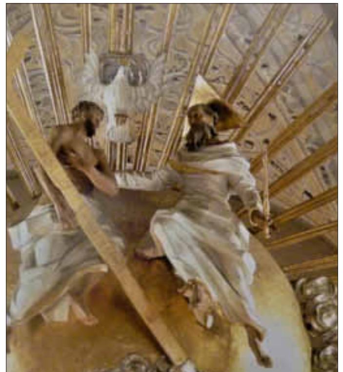
Am vierzigsten Tag der Osterzeit feiert die Kirche Christi Himmelfahrt. Wie auf dem Hochaltar in Marienweiher zu sehen, feiert die Kirche, dass Jesus zur Rechten des Vaters erhöht ist.