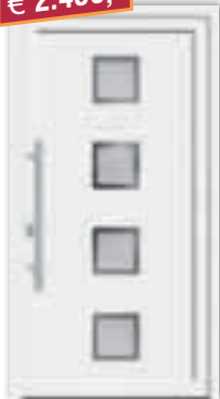
Kunststoff-Haustür "7743-50", weiß Glas „G500-25“